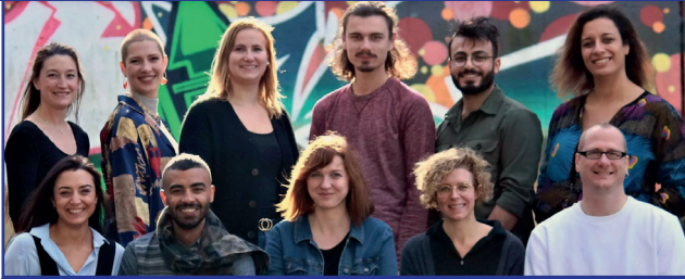
Das Ensemble des Forumtheater Ruhr | www.forumtheater-ruhr.de

Rassismus und Mobbing werden heutzutage - mal deutlich, mal unterschwellig - in vielen Alltagssituationen erlebt. Mit der Methode des „Forum Theaters“ entwickeln wir zusammen mit dem Publikum gute Lösungen für solche Situationen. Die Methode ist unterhaltsam und ermöglicht den Zuschauerinnen und Zuschauern spielerisch in schwierigen Situationen mehr Leichtigkeit zu erfahren.